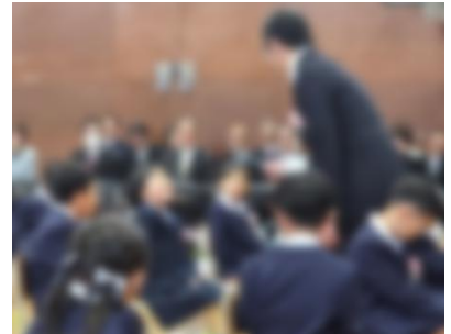
【名前を呼ばれて元気にお返事！】

早速13日には対面式を行い、縦割り班活動が始まりました。緊張している1年生を、上級生が優しくサポートしてくれました。また、14日は初めての給食、メニューは肉じゃがでした。「食べられるかなあ」という心配をよそに、よく食べてくれています。準備や配膳の仕方も少しずつ覚え、楽しい給食の時間を過ごしてほしいと思います。