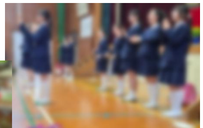
【6年生による歓迎の言葉】